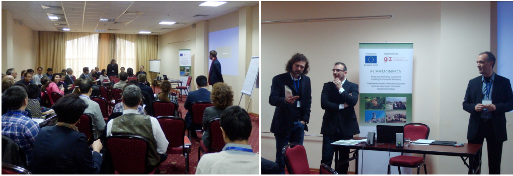
Презентация инструмента K-Link на семинаре в Бишкеке, Кыргызстан.

сталкиваются с проблемой собственности: почему учреждение должно «делиться» своими данными с другими учреждениями? Эта проблема встает еще более остро, если учреждения, о которых идет речь, расположены в разных странах. Чтобы обойти эту проблему, инструмент K-Link отказывается от идеи создания центрального узла или предложения разработки единых стандартов по адаптации к изменению климата и устойчивому управлению земельными ресурсами. Напротив, K-Link стремится просто находить уже существующие